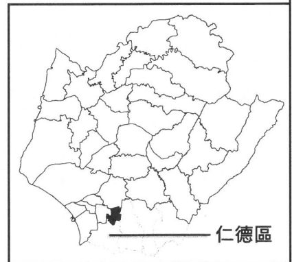
圖1 計畫位置與範圍示意圖